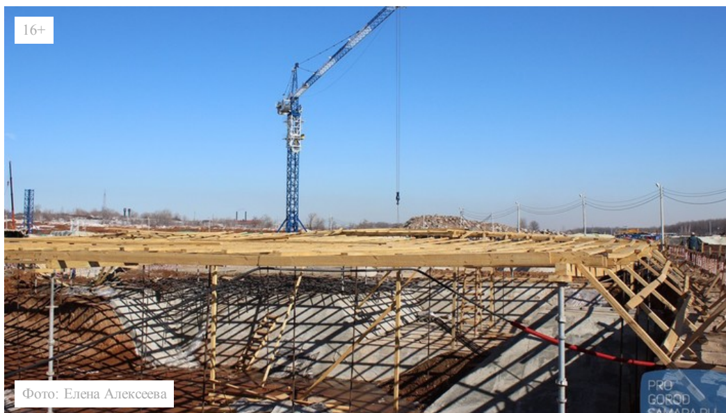
Фото с Радиоцентра: Сколько человек строят стадион к ЧМ и какую зарплату они получают

ProGorodSamara.ru узнал, как идут работы по строительству 45-тысячной арены в Самаре